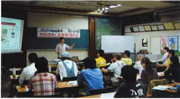
web活用塾でホームページ改善を熱心に学ぶ

レンジショップのためのスペースを用意し、村内外の創業予定者を後押し、村内の事業者数を増やし村の活性化に結び付けていければと考えています。