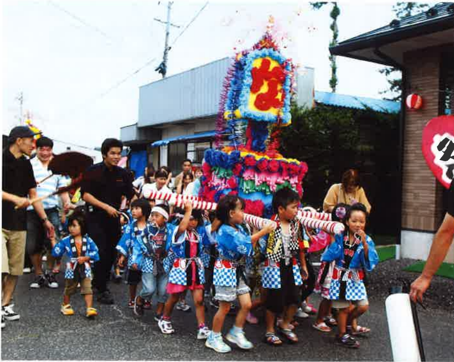
かわいらしい子供みこし

夏まつり当日は、朝九時頃と、夕方六時三十分頃に激しい雨が降りましたが、幸い大煙火大会が始まる頃には雨もあがり、おかげで涼しさを感じ しながら迫力満点の花火を見ることができました。 午後五時四十五分の開会式をかわきりに、保育園児や小学生らのみこしや大人みこし、