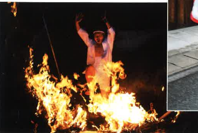
火の輪くぐりの神事

阿智川河畔では、大煙火大会が盛大に行われ今年の阿智の夏まつりが無事終了しました。