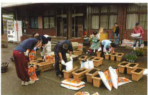
プランター花植え作業

て、本年度は決算のみで総会がありません。今年度の事業計画について、役員会で検討したところ、昨年引き続き、東西の自治会との共催行事と、地元をもっと知ろう事業を実施しようということになりました。先ず自治会との共催事業では、東地区については、六月十六日(日)にプランター花植え作業を行い、智里東公民館と昼神温泉ガイドセンターに設置しました。西地区については、環境整備作業を計画しています。