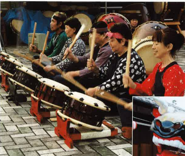
太鼓のみごとな演奏

また、東山道火の道太鼓まつりの太鼓の演奏に送られて、厄年の男衆による虫送りの松明行列、御水渡り、火の輪くぐり、火振り、火落としの神