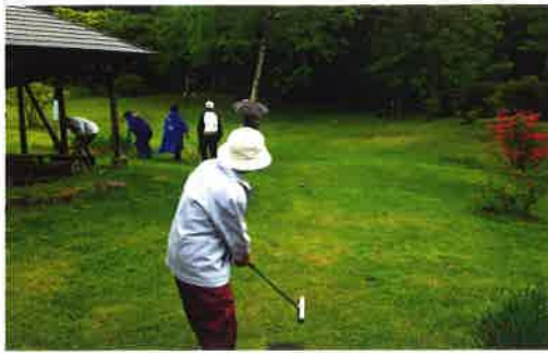
総会に併せて実施したマレットゴルフ

本格的夏を迎える治部坂高原、一人でも多くの方々に高原のあのさわやかさを楽しんでいただければと思います。