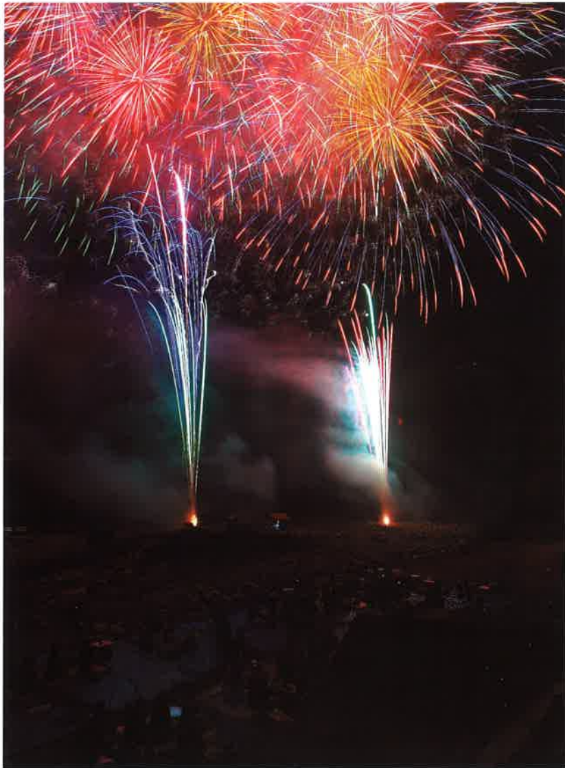
盛大に開催された大煙火大会

URL: http://www.achimura.com/ メール: info@achimura.com