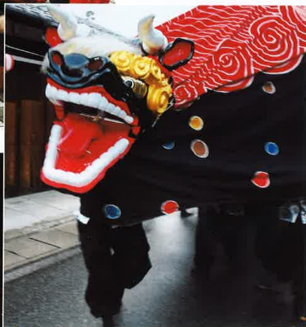
阿智黒丑舞の演舞

事が粛々と執り行われ、夜の闇と、まつりの火のコントラストは、見る者の目を引きつけずにはおりませんでした。