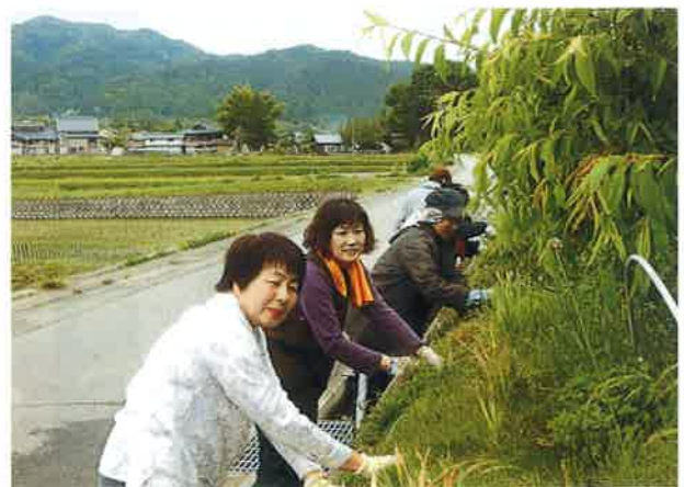
5月29日「そら」でのボランティア活動

去る七月九日、女性部恒例のスポーツ大会が行なわれました。熱中症注意報！がでていいる今日この頃、マレットゴルフとは、大丈夫!と思いましたが、木槌の森は、森というだけあって木がたくさん！みんな実に快適にプレーしていました。 終了後、南国飯店へ移動し冷たいウーロン茶で乾杯！おいしい料理をくるくる廻していただき、いろいろな情報交換をして解散しました。 久しぶりに女性部のパワーをもらって帰りました。