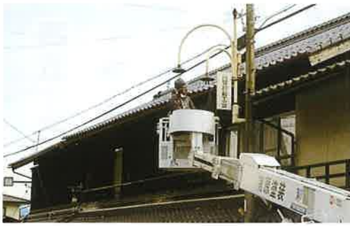
駒場地区の街路灯撤去作業

灯撤去作業も、後二箇所のコンクリート基礎の掘り出し作業のみとなり、撤去作業中大変ご迷惑をかけ、ご協力有難うございました。