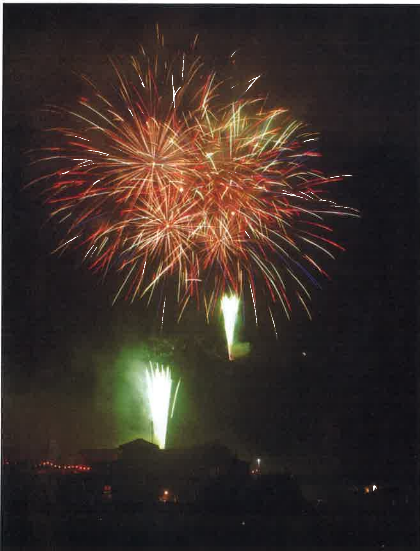
好天のもと盛大に開催された今年の大煙火大会

残る煙が、ほのかな風に流されていく。そしてタイムミン グよく次々と山峡を照らす大 輪の花、山々を揺るがす大音 響。これぞ阿智の花火の醍醐 味。拍手と歓声がわきあがる。 お陰様に今年は絶好の花火 日和、最高の花火大会でした。 「よかったなあ。」「来年も見 に来るでな。」と、河川敷で見 上げていた方々も、帰りがけ に口々に声をかけてくれました