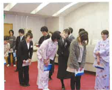
新入社員研修でのおじぎの練習風景

地域経済を支えているのは企業です。その企業を支えているのは優秀な人材です。そこで、今年度商工会では村内企業の明日を担う人材育成に取り組むことになりました。